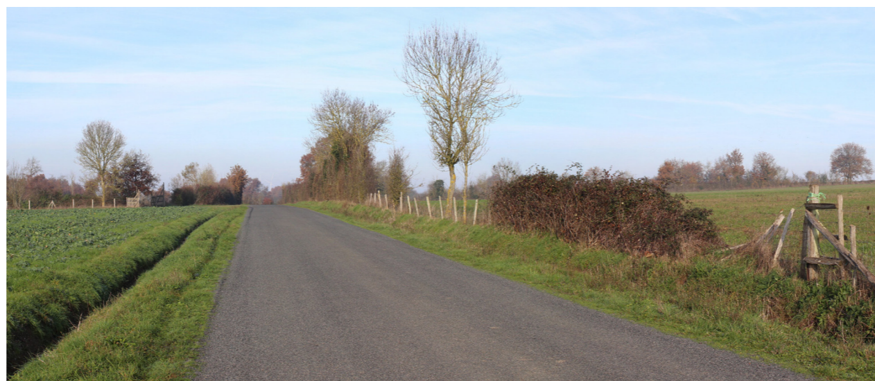
Photographie de l'état initial à 50°